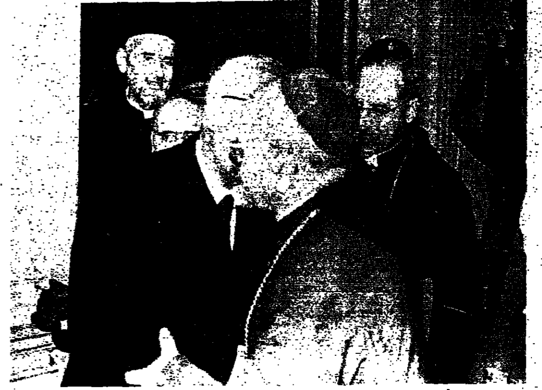
الرئيس فرنجية يعاقب غبطة البطريك خريش مهنا مساء امس